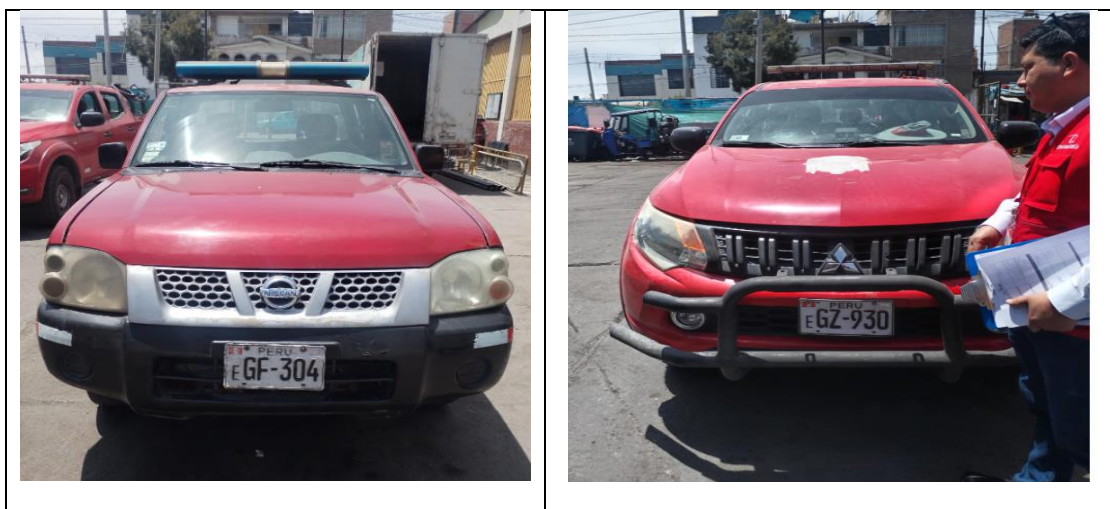
IMAGEN N° 3 VEHÍCULOS ASIGNADOS A LA GERENCIA DE GESTIÓN AMBIENTAL QUE NO CUENTAN CON DISTINTIVO INSTITUCIONAL

En ese sentido, el 19 de noviembre de 2024, se realizó la inspección física, al almacén San José de la Municipalidad Distrital de Miraflores, ubicado en la avenida San Martín s/n del distrito de Miraflores y en compañía de la gerenta de Gestión Ambiental, suscribiéndose el “Acta de visita a campo n.º 01-2024-CG/OC0353-SCC-SLP”, en la cual se dejó constancia, que las unidades vehiculares asignadas a dicha gerencia, camión cisterna, placa EGV 345; camioneta pick up, placa EGF304; no cuentan con distintivos institucionales que permita su identificación, así mismo, la camioneta pick up de placa EGZ 930 cuenta con un logo institucional desgastado solo en la parte superior de la tapa, lo cual no permite su identificación, conforme se muestra a continuación: